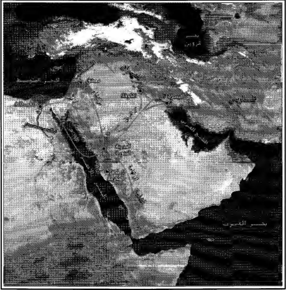
خريطة (٢) الإغاثة في عام الرمادة